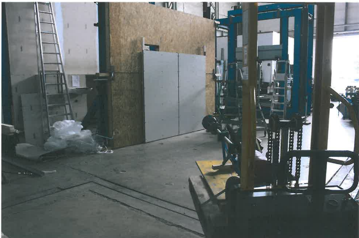
Abbildung 2: Ansicht des Prüfaufbaus und des Ballschussgerätes – Beschusswinkel 45°