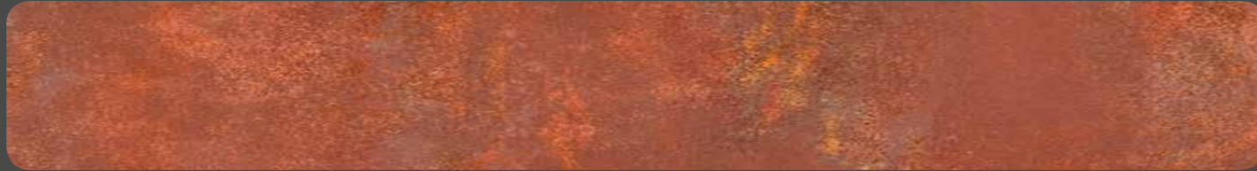
CORACERO B MAT