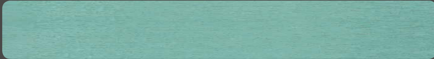
PATINA COPPER MAT