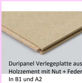
Duripanel Verlegeplatte aus Holzzement mit Nut + Feder In B1 und A2