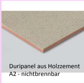
Duripanel aus Holzzement A2 - nichtbrennbar