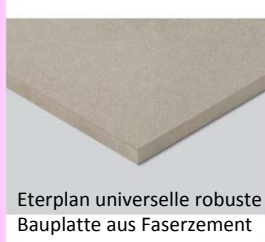
Eterplan universelle robuste Bauplatte aus Faserzement