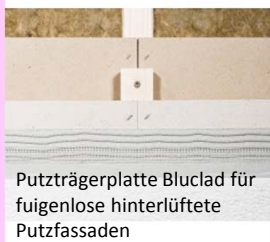
Putzträgerplatte Bluclad für fuigenlose hinterlüftete Putzfassaden