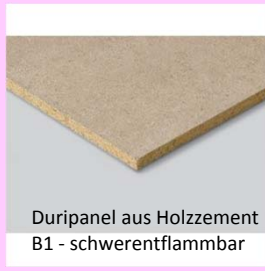
Duripanel aus Holzzement B1 - schwerentflammbar